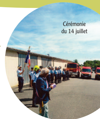
Cérémonie du 14 juillet