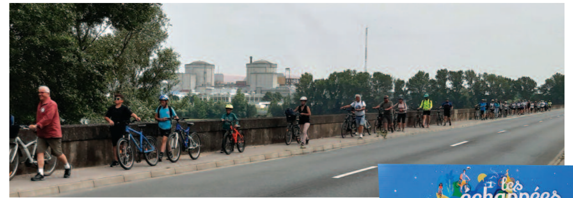
Les échappées à vélo Les Indes de l'Anjou Les Carrières - Vallée de l'Anjou