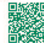
Site du Parc Loire-Anjou-Touraine

Consultez le dossier complet, retrouvez tous les lieux d'enquête, les dates des permanences et autres informations en ligne.