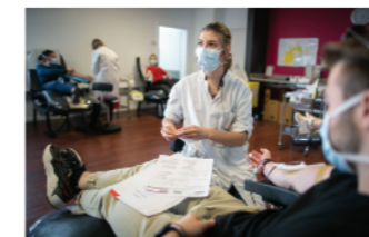
sanguine peut contribuer à les soulager ou à les guérir.

Le don de sang, un acte citoyen et solidaire indispensable pour sauver de nombreuses vies !