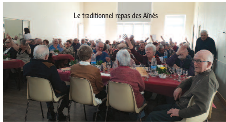
Le traditionnel repas des Aînés