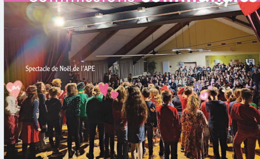
Spectacle de Noël de l'APE