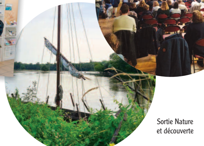
Sortie Nature et découverte