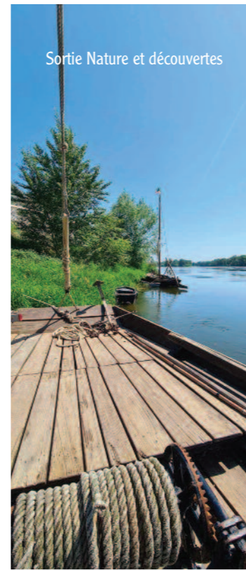
Sortie Nature et découvertes