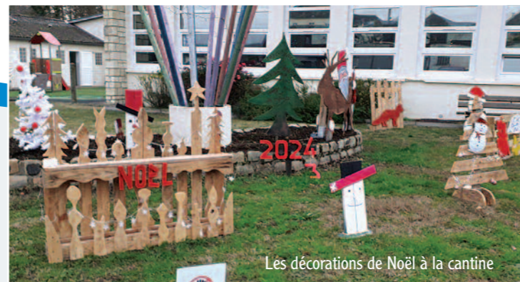
Les décorations de Noël à la cantine