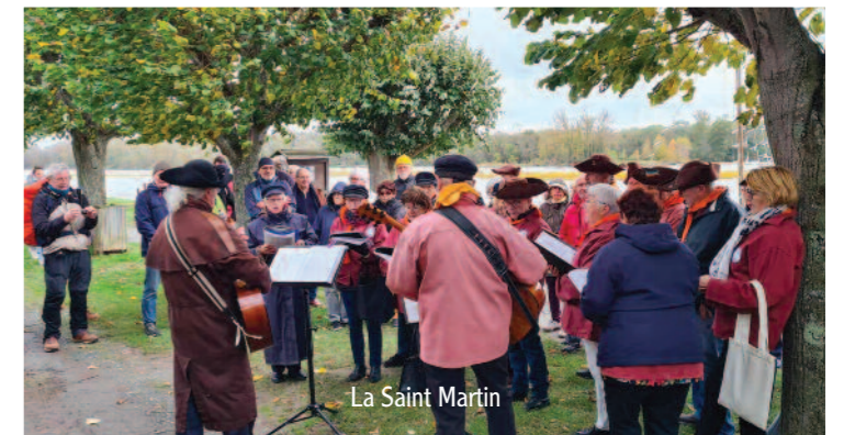
La Saint Martin