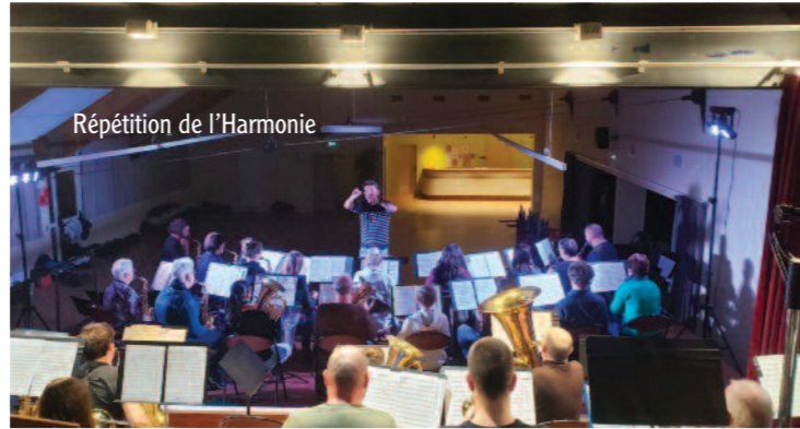
Répétition de l'Harmonie