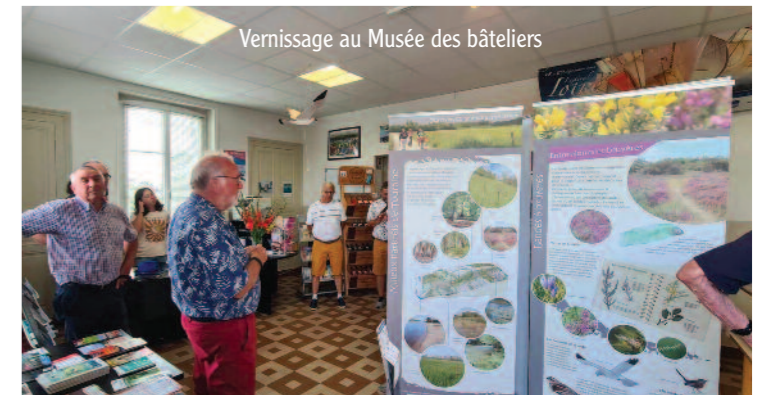
Vernissage au Musée des bâtelières