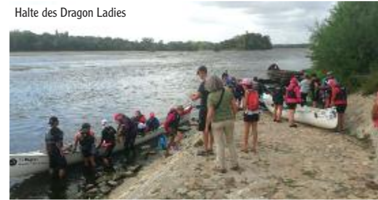
Halte des Dragon Ladies