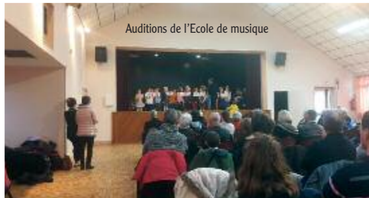
Auditions de l'Ecole de musique