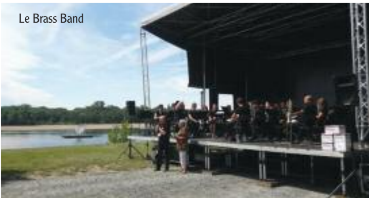
Le Brass Band