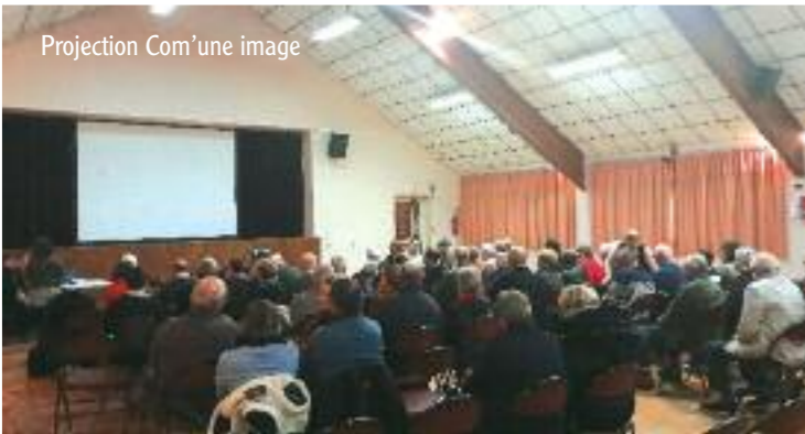
Projection Com'une image