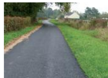
Le Clos Violet et la Rue des Bruns

Pour le camping : travaux d'électricité dans le chalet.