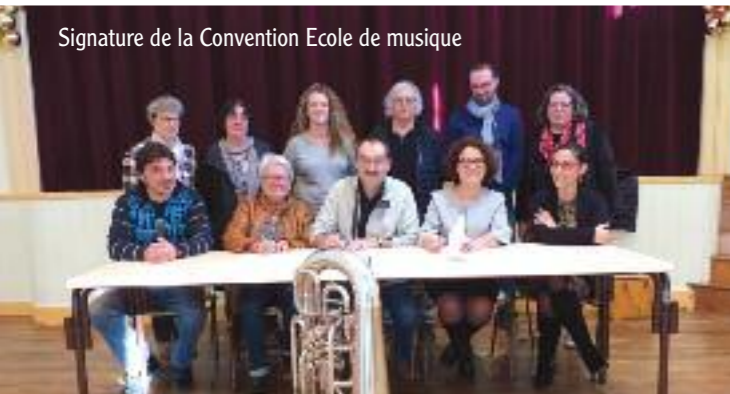
Signature de la Convention Ecole de musique