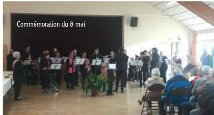
Commemoration du 8 mai