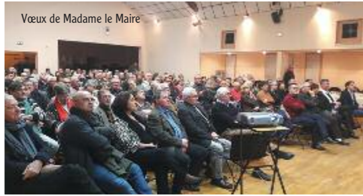
Vœux de Madame le Maire